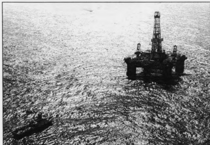
Fyri stuttum kom »Sovereign Explorer« fram á eina rimmarstóra oljukeldu beint við føroyska markið

Enn einaferð hefur tað eydnast at finna olju heilt tætt við føroyska markið. Hesaferð er talan um eina rimmar oljukeldu, sum samtakið við Arco og Conoco hava funnið