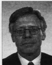
Á ferð síni í Noregi skal lögmaður bæði hitta norska forsætisráðharran, Kjell Magne Bonnevig og uttanríkisráðharran, Knud Vollebæk