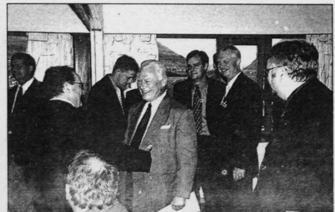
Her heilsar Schlüter uppá fólk áðrenn fyrilesturn. Fremst á myndini sæst lögmaður