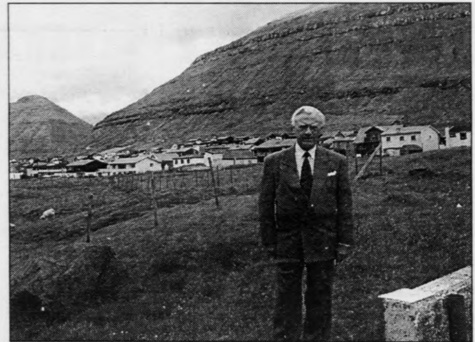
Ein verðinsmaður í Klaksvík