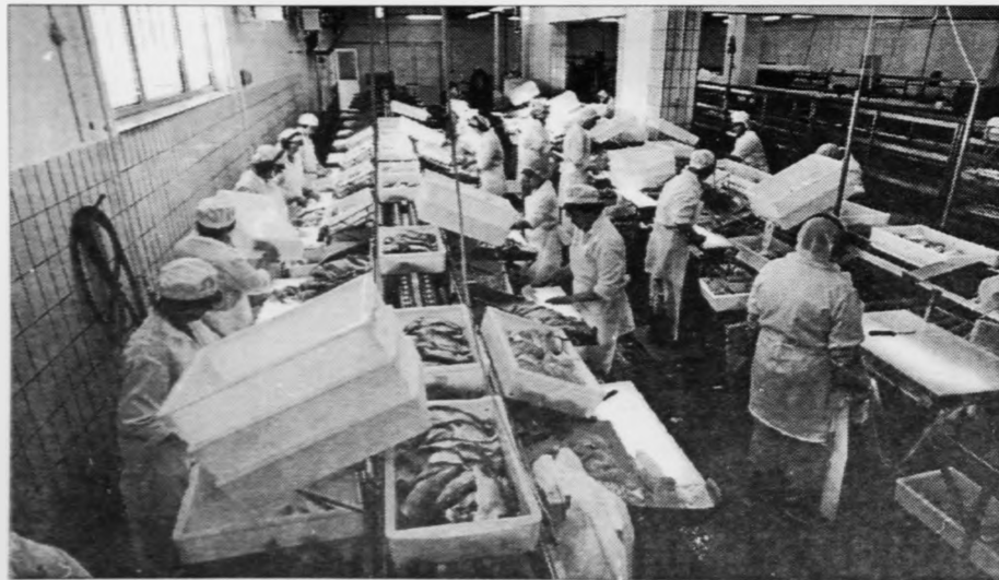
Virksemlí kom rættiliga í gongd aftur í Miðvági, tá ið flakavirkilø byrjaði aftur síðsta heyst

So fáa vit at siggja um oljublóðran fer at uppylla dreyrnar.