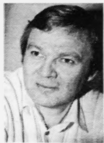
snarast um somu tíð.

Vit kunnu í hesum høpi siggja tann almenna bygnaðin sum eitt slag av »Kolumbaseggis«, tí honum liggja minst 4 ymskiri lykklar, sum kunnu