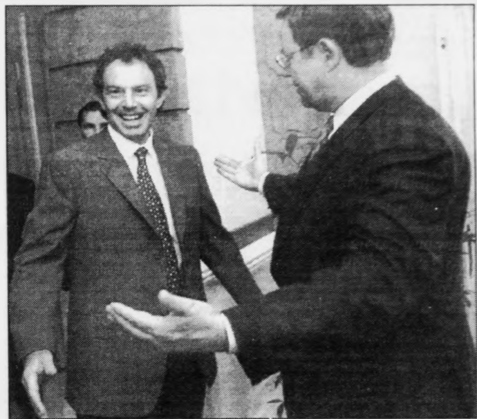
Tony Blair og Nyrup umrøddu markið millum Føroyar og Bretland á fundi í Keypmannahavn mánakvöldið

Eisini skal Uttanlandsnevndin, sum eisini er nýggj, kunnast um málið og takast við uppá ráð.