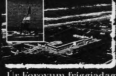
Úr Føroyum friggjadag