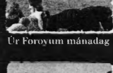
Úr Føroyum mánadag