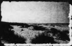
Úr Føroyum friggjadag