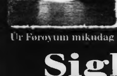
Úr Føroyum mikudag