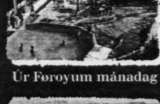
Úr Føroyum mánadag