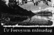
Úr Føroyum mánadag