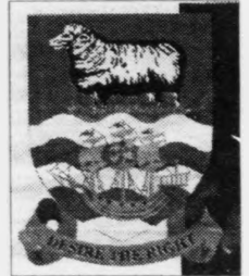
Eins og feroingar hava Falklandsøygjar eisini seyðin í sínum skjaldramerki

Tað merkir, at talan kann verða um 50 mill. kr. til hvønn íbúga á Falklandsøygjunum skrivur Daily Mail. Bretland fer so at krevja ein part av oljuinntøkunum, nú landið hvør ar