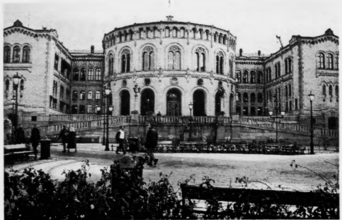
Norska stjórn og stortingið eiga nú at broyta uttanríkispolitikkinn mótevígis londunum í Útnorði, Føroyum, Íslandi og Grønlandi og ganga meira virkið inn fyrri at menna hesi økin

-Vit í Noregi hava frá fyrstan tíð gjørt eina lóggávu,