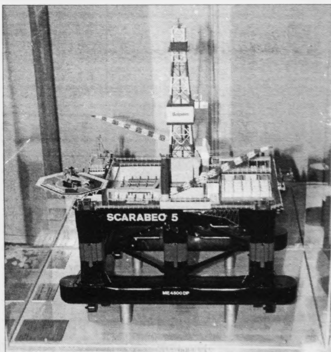
Hesin boripallurin verður sýndur fram á sölustevnuni á Tvøroyri, sum letur upp í dag og er opin til sunnudagin