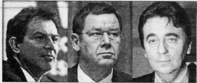
Løgmaður heitir nú á Poul Nyrup Rasmussen um at fáa bretska forsætisráðharran, Tony Blair upp í trætuna um markið millum Føroya og Bretland

Løgmaður hefur sent danska forsætisráðharranum bræv, har hann biður Poul Nyrup Rasmussen seta seg í samband við Tony Blair at vita, um bretar eru fúsir at viðgera marknatrætuna á politiskum støði