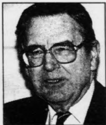
muliggjorde en hurtig genopretning.

Som nævnt var formålet at få sat skub i den færøske samfundsøkonomi, og det lykkedes. De mange penge, der blev ofret, forsvandt ikke ned i et sort hul. De blev den saltvandsindsprøjtning, der