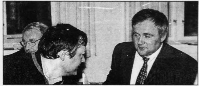
Roynt verður at fáa semju um eitt felags álit um oljulóggávu

Vinnunevndin hevur tósáð við nógv fólk eftir, at uppskotið varð til 1. viðgerð á tingi í november. Teirra millum er lögmaður, sum umsitur oljumál og stjórin í