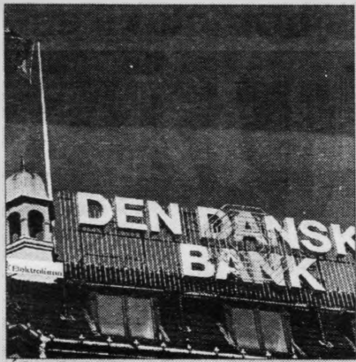
A høvuðsskrivstovuni hjá Den Danske Bank hava teir nærslíð frágreiðingina - og skift meining