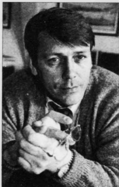
Jóannes Eidesgaard formaður Javnaðarflokksins