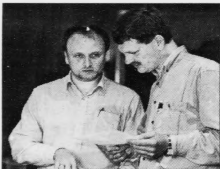
Tvey av fólkunum á Fiskirannsóknarstovuni við á GEM-seminari í Havn

-Hatta er ein sera áhuga-verdur spurningur, sum eisini hevur verið reistur av fólkum her á teimum seminarum, sum hava verið í GEM. Eg haldi hetta er týðningarmikið at taka upp. Spurningurin er, so um tað er GEM ella kanska eitt heilt annað fornum, sum skal taka hetta upp.