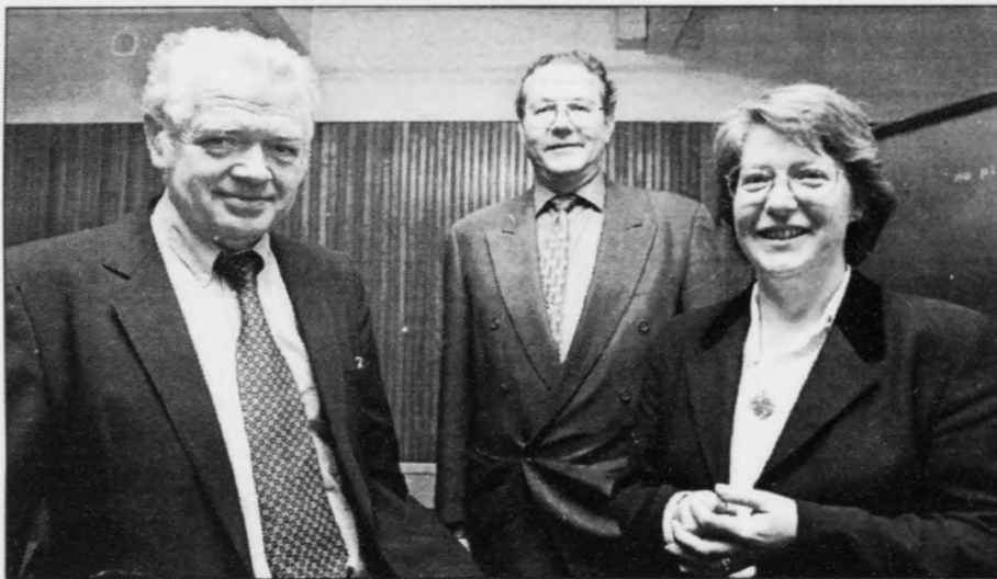
Frá seminarið, sum GEM skipaði fyri á Hotel Hafnia í farnu viku fyri umboðum fyri stovnar á Debesartøð. Evdamálið var at læra hvør annan at kenna og at kunna um oljuvinnuna.