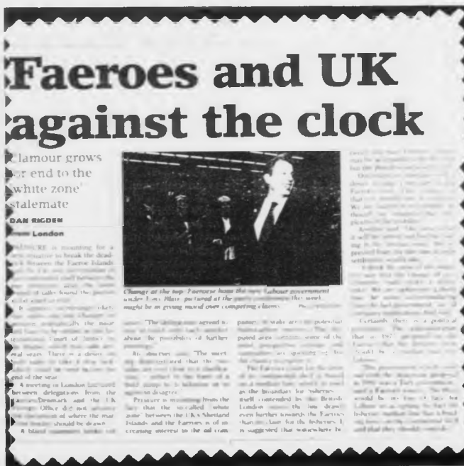
Greinin í altjóða oljubleiðnum „Upstream“ við mynd av bretska forsætisráðharranum, sum kann loysa marknatrætuna millum Føroyar og Bretland

taka fleiri ár. Kortini tykja stáðir partar at vilja royndu affur á einum nýggjum fundi, sum skal vera aðrenn hetta árið er úti.