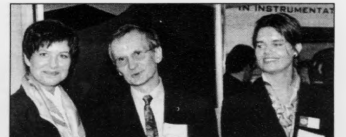
Frá oljumessuni í Aberdeen í 1995.

Aberdeen, Fróðskaparsetrið, Landsverkføðingurin, Toll- og Skattastovan, Vinnuálastýrið, Heilsumverkið, Farec, Atlanticon, Sofus Jacobsen, Consulting Engineering, Stephanssons Hús, Faroe Travel, Tórshavnar Havn, Flugfjarðar Havn, Vestmanna Kommuna, Tvøroyrar Kommuna, Klaksvíkar Kommuna og Rasmussen & Weihe. Oljumessan og ráðstevnan verður í døgnum 9. til 12. september. Farið verður við Atlantisflog sunnudagin kl. 17.30. Ferðalagið er heima aftur fríggjakvöld.