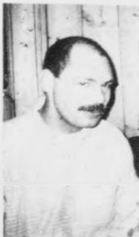
Tjambalay Hjartalga tillukku við degnum 24. 8 Heilsan Tjambelana