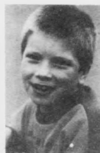
Góði Karstin Hjartalga tillukku við 11 ára föðingardegnum í dag Ynskja mamma og babba