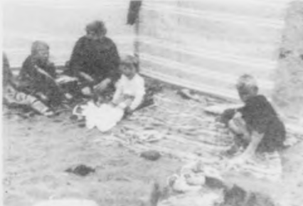
Góða argjaomma' Hjartalga tillukku við degnum. Takk fyrir allt það, tú ert fyrir okkum. Vonandi verða það nógvir túrar afturat Heilsan ommubörnini