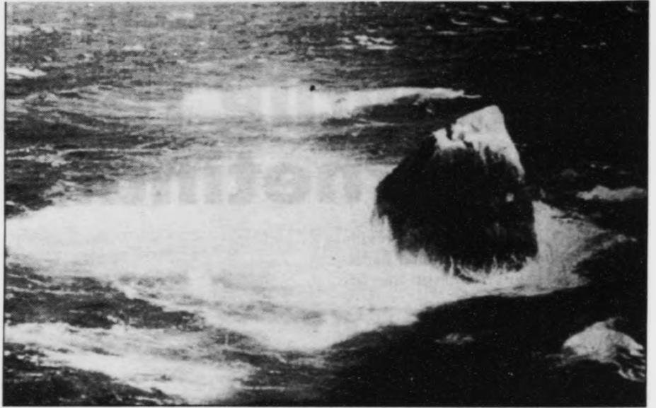
THE ATLANTIC FRONTIER Oil and Gas Exploration and Production

Herfyri útsetti BP framleiðsluna frá tí fyrstu oljufeløgnum vestan fyrst Hettland í óvissa tíð. Orsøkin er sambært BP tann, at teir hava funnið onkur brek á útbún-