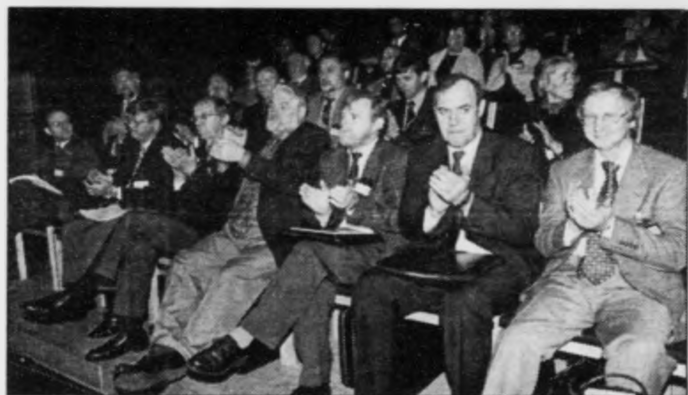
Framhald av síðu 9

Føroya Oljuidnaður og Saga Petroleum ved denne konference har valgt at fokusera på netop samspillet mellem olie, fisk og industri.