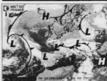
Eitt hátrýst liggur fyrstu dagarnar millum Skotland og Island, men viknar nakað sum fráliður.