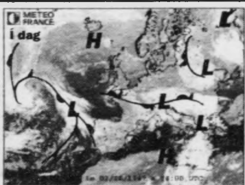
Lágrýst norðanfyri Island fer eystureftir og veik brúgvæløg haðani bera stundum við Føroyar.

Mai bleiv nakað kaldari enn vanligt - 6,3° móti vanligu 7,0°