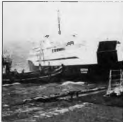
Tíbetar vóru veðurgudarnir við Dúgvun, tá hon fekk maskinskaða mikudagin.