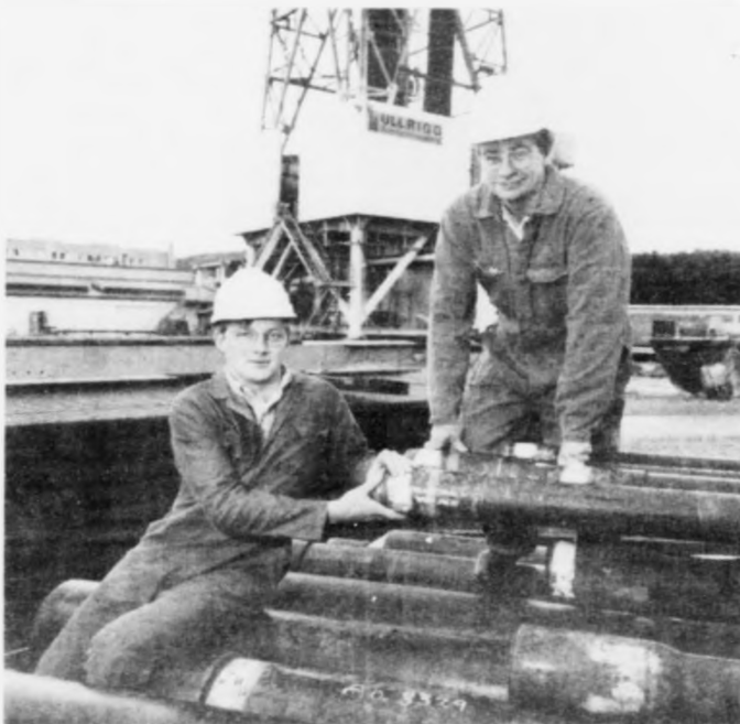
Vitjan løvnaðs í Oljunoregi kemur í kjalarøttum á teimum avtalum, sum eru gjørdar millum norsk og føroyskar útbývingarstovnar. Helst verður havið hjá lögmanni at hitta føroysingar sum útbýgva innan oljuvinnuna í Noregi.