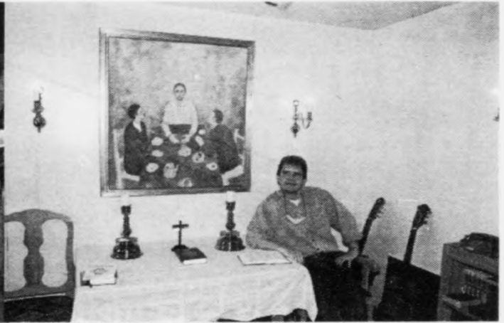
Fyrirverandi sjómanspreturinn og nú sjónvarpsmaður kennir seg ikki sørt heima í kapellinum umborð á Ekofisk