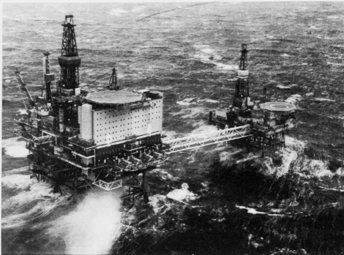
Ein lítil partur av tí risastóra Ekofisk kompleksinum

Elsta og eitt tað størsta olju- og gassfeltið í Norðsjónum - Ekofisk - er einki minni enn ein pengamaskina - fyri norska statin og fyri oljufelagið Phillips. Í samfull 26 ár hevur oljuspæranur staðið upp úr teimum mongu boriholnum á hesum risastóra feltinum. Phillips er farið undir eina útbýggingarætlan fyri 18 milliárd krónur og hevur fingið langt loyvið at framleiða til ár 2026. Tá hevur feltið verið í brúki í nærum 60 ár og kortini verða tá meira enn 60% av oljunni eftir í gøymslunum.