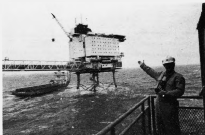
Blámadurin á Dimmalætting, Dra Midjord til arbeiðs umboð á Ekofisk

Annars er tað Phillips í Bretlandi, sum tekur sær av leitingini á øllum Atlantismotnum og tess eins við