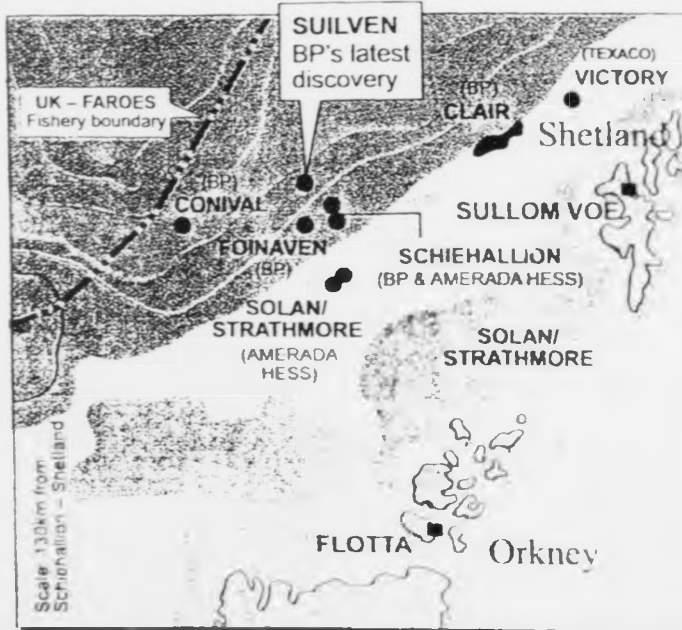
Sulven oljufundur, sum BP hevur funnið, liggur á sjálvum markinum til grannateigin, id higar til hevur verið partur av Hvíta økinum (tvs. øki, sum hvorki føroyingar ella breta hava gjørt krav uppá) men bretar nú hava kunnað sær. Hetta eru teir noyðdir til, um teir skulu til at troysta nýggju kelduna.