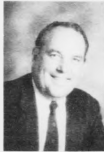
vestan fyri Hetland