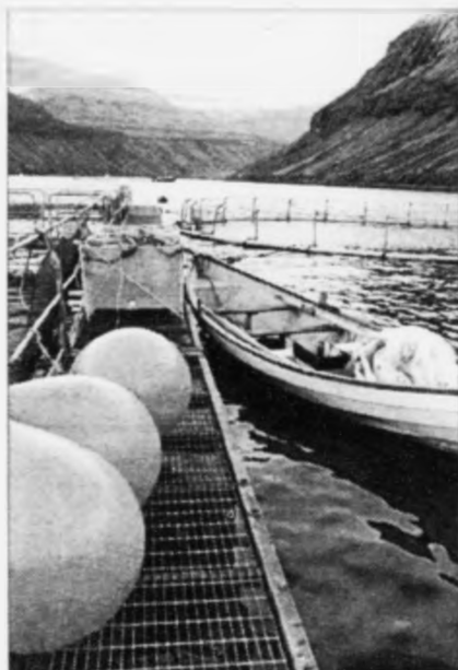
Teir, ið selja fòdur, fíggja millum 80 og 100 milliónir kronur í føroysku alivinnuni