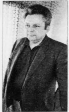
- Útreiðslurnar til lønir eru ov stórar sum er, siga arbeiðsgevararnir

Ráðstevnan í Norðurlanda-húsinum byrjar í dag, og nógvir útlendingar eru komnir til landið. Lesið annars temablaðið í Sosialinum