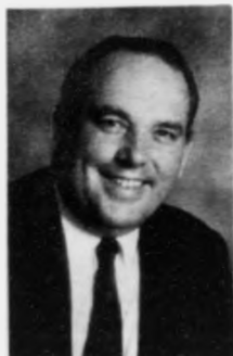
Lord Fraser, orkumálaráðharri, sum hevur eina ætlan fyri oljuleiting og framleiðslu á eitt nú Atlantsmótinum langt inn í næstu öld

Talan er um at hava útbjóðingarumfær á hvørjum ár tey næstu 3-4 árin. Eisini nam Lord Fraser við møguleikan at loyva »opnum« boðum, har oljufeløgini kunnu bjóða uppá øll øki í bretska sektorinum. Hetta hevur verið ynski hjá nóg-