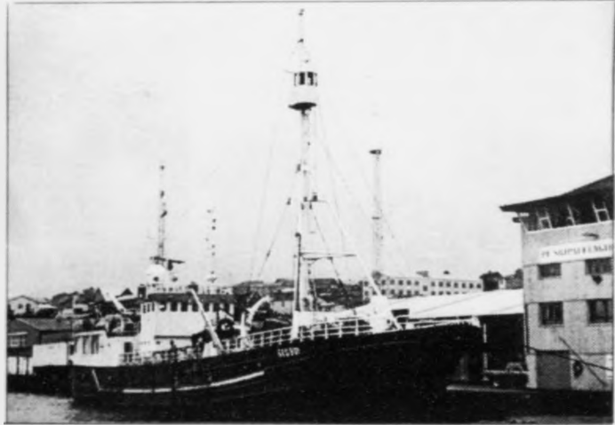
Kanningarnar vórðu gjørdar í august í fjør við norska skipinum Geohoy. Mynd Jan Muller

Eftir ynski frá serstakliga Olju-ráðingini vórðu eisini fleiri vísindir tiknar vestan fyrri Føroyar. Eftir øllum at døma var hetta eitt skilgott val, tí eisini í hesum økinum lekur olja upp. Mynd Jan Muller