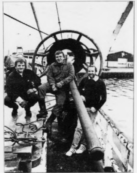
Utgærðin, sum varð brúkt til at taka upp botnpróvarnar við olju í. Mynd Jan Muller

Í fjór fór norska fyrirtøkan Surface Geochemical Services so undir nakað líkandi kanningar, hesaferð niðri á sjálvum havbotninum. Er olja at sigga á havvirkilatum, so átti at verðið meira sannlíkt, at