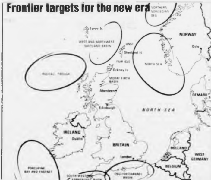
Kort í The Economist í 1981, sum vísir komandi oljuøkni í Europa. Vit siggja aftur her Atlantismótið við m.a. Føroyum

skaparlíga og tekniliga ómøguligt at koma fram at oljun.