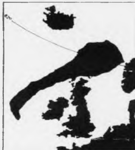
Oljubassengið - lagdin - á kortinum í Børsen - røkkur heilt frá miðnøregi og vestur um Írland og fellur sum so saman við teoriunum, sum fleiri av oljufeløgnum arbeida við í dag, sum m.a. ganga undir heitinum „Western Slope“ - vestara landgrunnshellingin. Tað verður unnuars nógv tosað um at finna ein risastóran elefant á hesum øki (tvs. eina ógvuliga stóra oljukeldu). Um tað er nærtað ella ikki, so skal tó ikki nógv hugfloð til at siggja eitt elefanthøvð og snábul á kortinum. Hvør veit!

borað og framleitt verður á 200 metrar dýpi í Norðsjónum, so verður Norðugt