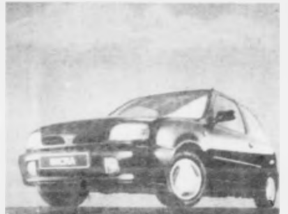
Óki er spurt í Micra - stóra, lilla bílarnum frá Nissan

1,3 mill. Nissan Micra eru nú seldir í Europa, síðani Micra kom á marknađin í 1983 og síðani 1992 hevur Micra veriđ framleiđdur á Nissan verksmiđjuni í Sunderland í Onglandi.