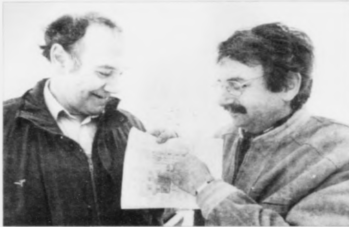
Framhald av vřđu 10

beiđi bæđi her eims væl og aðrastađni í verđini, og vit vilja bruka tann iđnađ og tær tenastuvinnur, sum eru í Føroyum.