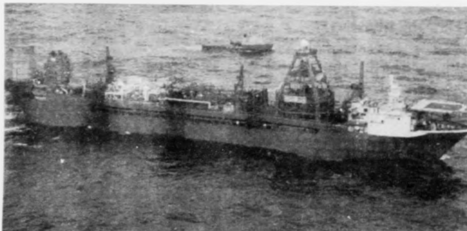
Førsta framlendsluskipið nákrantið vestan fyrri Hetland kom herfyri á staðið og tað skal vera frageiðing nógva komandi árini skipið etur Petrolul. Føroya er nu fest last í botnin við 8 stovum okki.

Føroya Kommunufelag leggur stóran dent á hesar spurningar og áttar sær eisini at vera virkið í hesum málum, sigur formaðurin í felagnum við Nostalin.