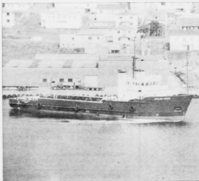
Førsta og higartil einasta útlendska suppli skipið, sum hevur verið í Føroyum komi á Vág herfrá við úgerð til borplássid í Lopra.