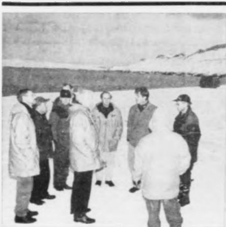
Undir vitjanini í Føroyum vóru norsku oljufelögin eisini á Sundi.

STIÐJAGOTA 11 POSTRUM 1078 110 TÓRSHAVN TLF. 11115 - FAX 17115