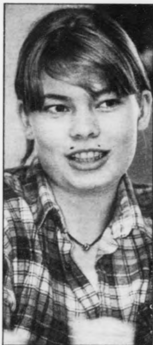
Meifrið er deyv: