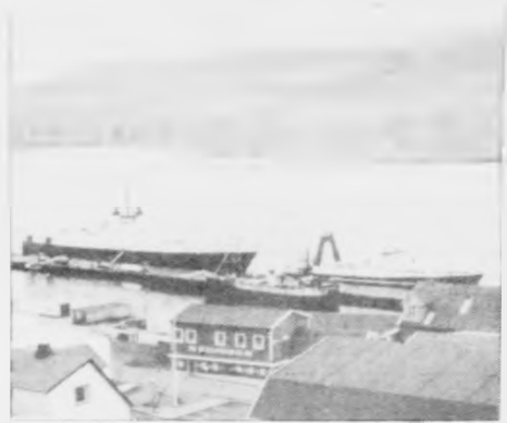
Úrslitini frá Geco My hjá seismikkfyrirkøpingu GEco. Prakti hava havt álstoran ísáttungu fyri AMG-samtakið.