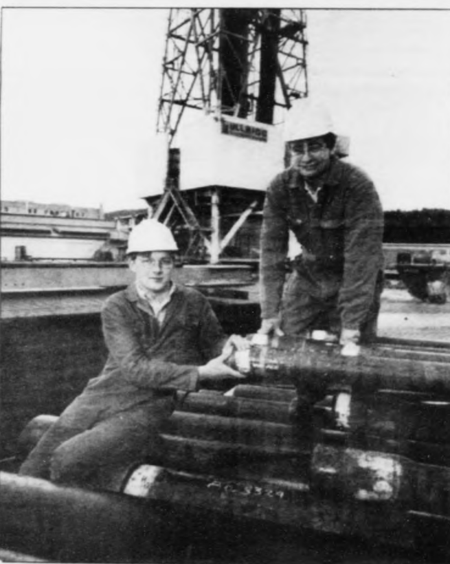
Her eru teir á myndarpalli Ullrigg í Stavanger.