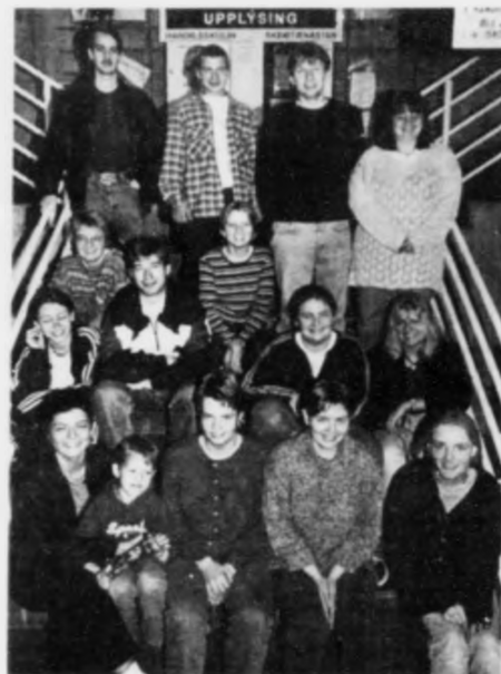
Næmingar og lærari á Handilsskúlanum klárir at fara til Skotlands at læra um olju.

Sambært utvarpinum í gjár so verður hildið fram við boringini, tí teir hava