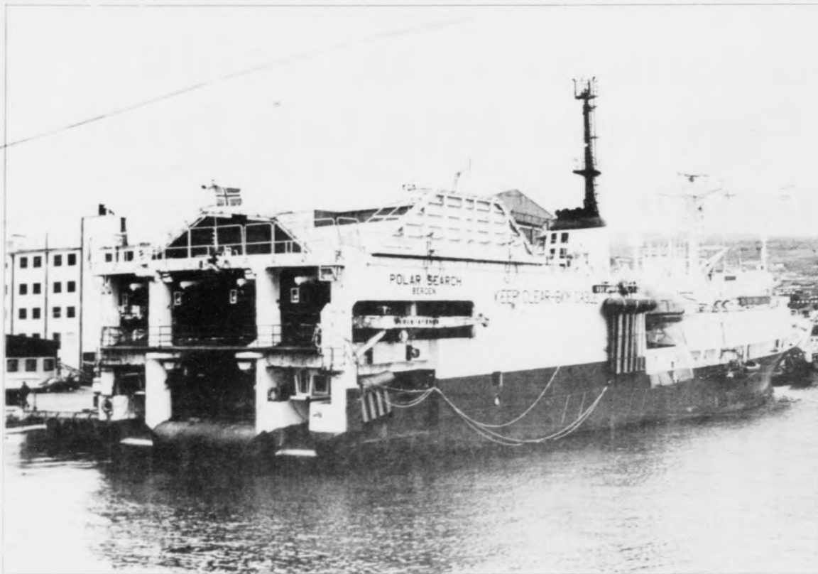
Polar Search er eitt tað størsta seismikkskipið, sum hevur lagt at í føroyskari havn.