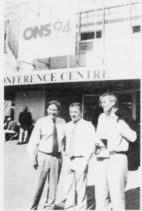
ONS stevna var eisini í 1994 í Stavanger

„Noreg fer at halda fram við at vera ein stórir, stóðugur og tryggur utflytari av orku. Noreg fer tí eisini í framtíðini at vera av stórum áhuga hjá altjóða olju- og gassídnadnum. Vit vilja tí halda fram við at gera tað attraktívt at gera íløgur her og at hava eina javnvæg millum eftirlit frá statinum