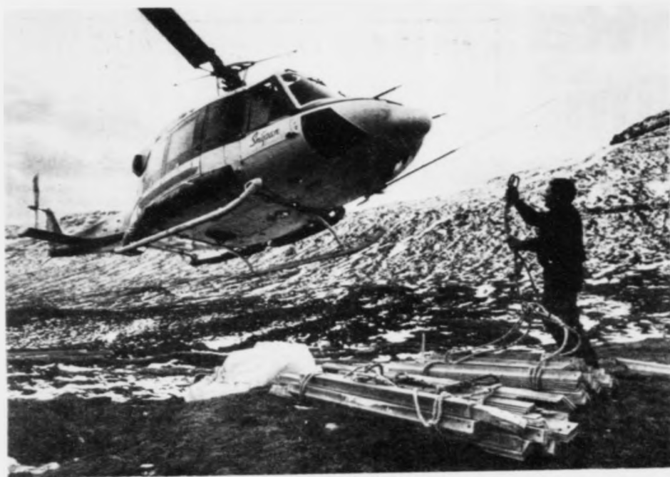
Føroyska Meginlands stjóðin Fjarstøðan frá flogvøllinum er merktur upp í málum. Verður talan um tyrluflutning á føroyskum hondum, verður talan um at flugva imillum 110 og 230 mil

koma eini 30-40% av manningum at bugva í Føroyum og 60-70% bugva uttanlands.