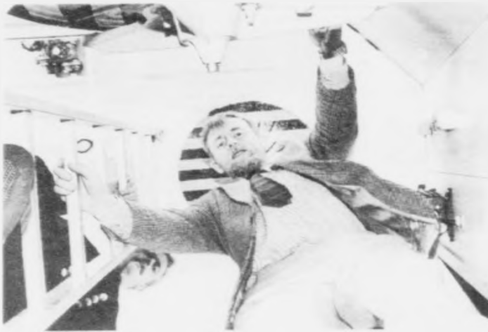
við tær fíggarjagur stöðurnar av oljuleiting

Heldur ta Føroyar einsamallur eru tørrar fyri at standa fyri einum slíkum oljuleit.