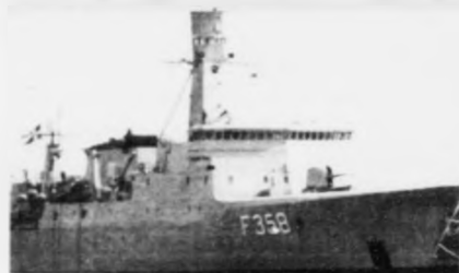
«Thetis» skal gera seismiskar kann- ingar saman við einum Westernskipi