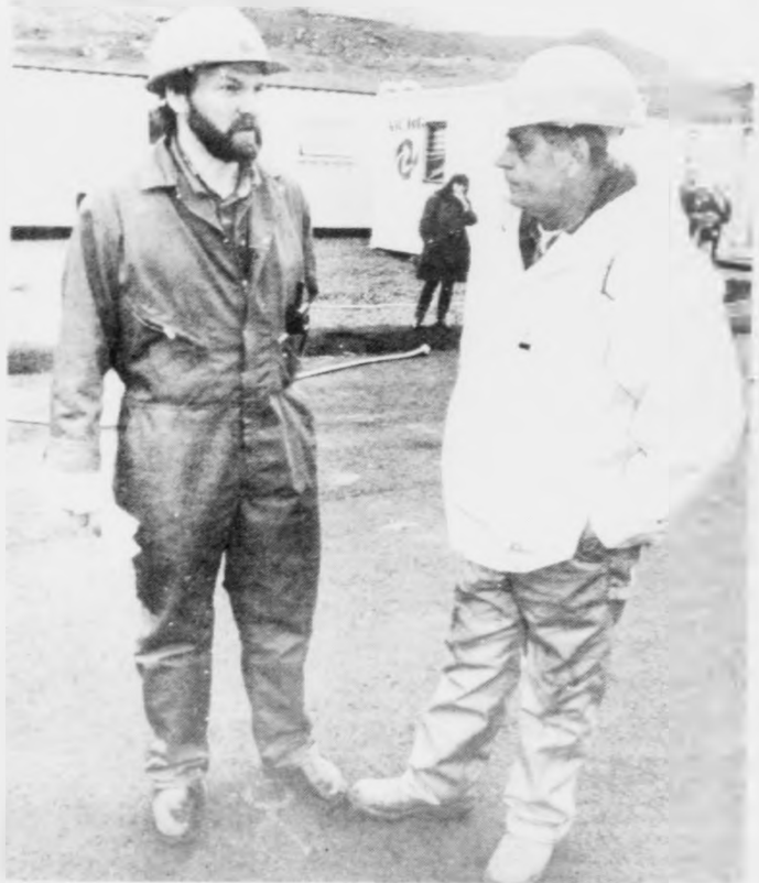
novica í oljuginnum

Við sínum 40 ára royndum er hann heldur eingin