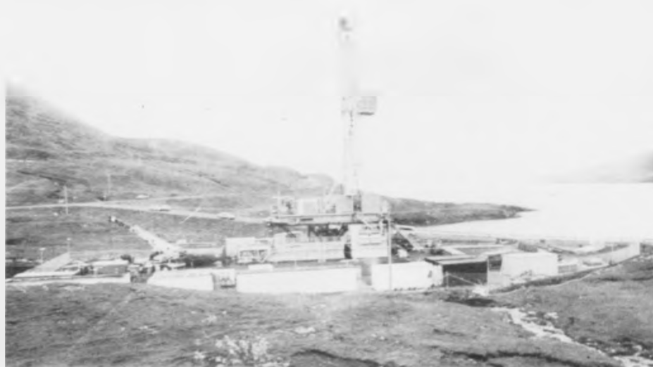
Botnirnið er 60 metrar høgt og kemur at standa klárt á neðrumum á fólki langt eftir, at tað er tikið niður.

Mættingar, sum annars verða gjørdar, verða fluttar elektroniskt á eina miðstöð í London og haddi til oljufeløgini. Jarðfrøðissavnið fær eisini tey úrslitini.