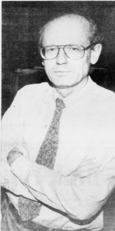
Føroyar bruk fyri vælutbynum fólki innan oljuspurningar Mew livir eisini hest trý olju

Vit hava í hesum sambandi gjørt ein snøggan faldara um Føroyar og kanningar okkara her. Hetta