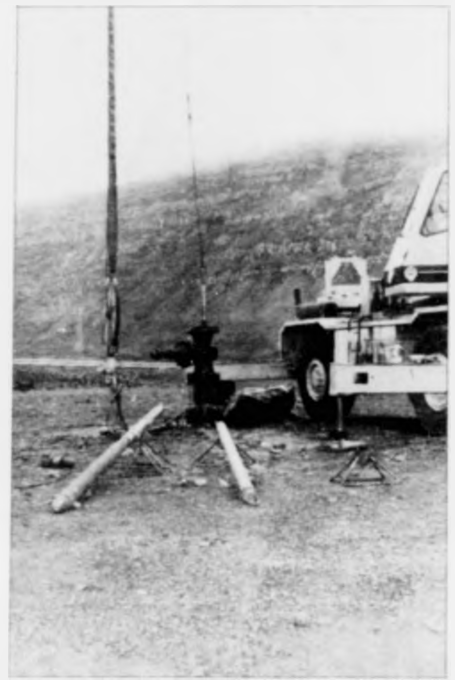
Lopransholið hevur elvt til mikið orðskjak

Hvørju viðmerking hevur tu til seinastu tíðindini, at Maersk als ikki varð við í utbyðingini frá byrjan, men at tað bad um at sleppa við og at tað síðani fekk uppgávuna? Um tað er stóran, so má