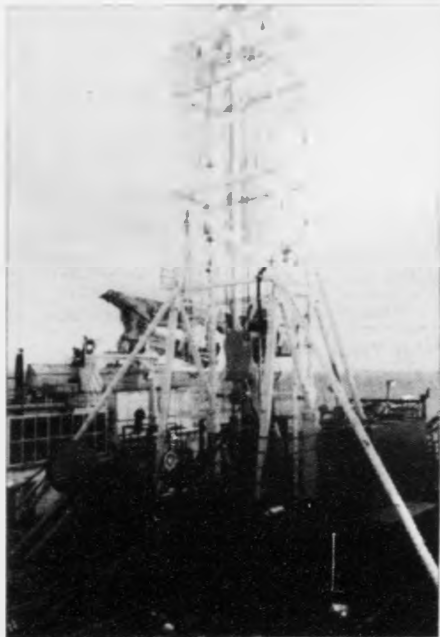
Borutornid á Mærskutgerðini

Eg vil tí ikki finnast at stöðum, ti tað eri eg ikki forur fyrri, men vil bert siga, at vit høvdu eitt sera gott projekt, sum ikki varð góðtikið. Tað einasta eg havi trætt síðani er ein linja í einum brævi, har tað stendur, at vit fingi ikki arbeiðið.