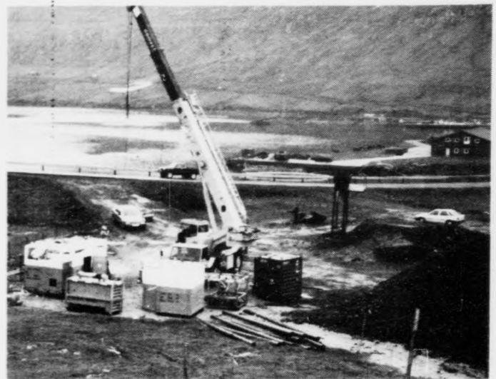
Tað fyrsta oljuævintríð í Lopra endaði ikki líka gott sum ævintríð flest.

Boringin í Lopra er útsett tveir mánaðir. -Eingin eigur at verða bilsin av um ikki alt gongur sum ætlað, tí hetta er fløkt at hava við at gera, sigur Dopas.