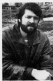
adur - stóðuni hjá vinnuni

Ein loyvir sær at tvast í evnunum hjá greinskrivarunum at meta um veruliga støðuna. Og eg havi hug at spyrja hann, um hann hevur gjørt sær bert minsta ómak