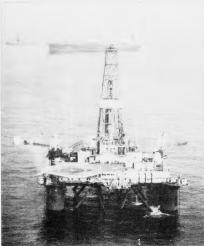
bretsku megin markaðsins finnast á føroyskum øki