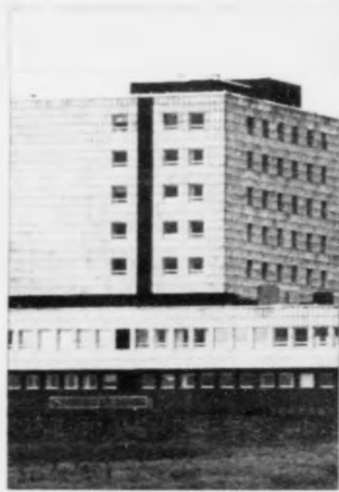
Stríðið á Landssjúkrahúsinum heldur fram