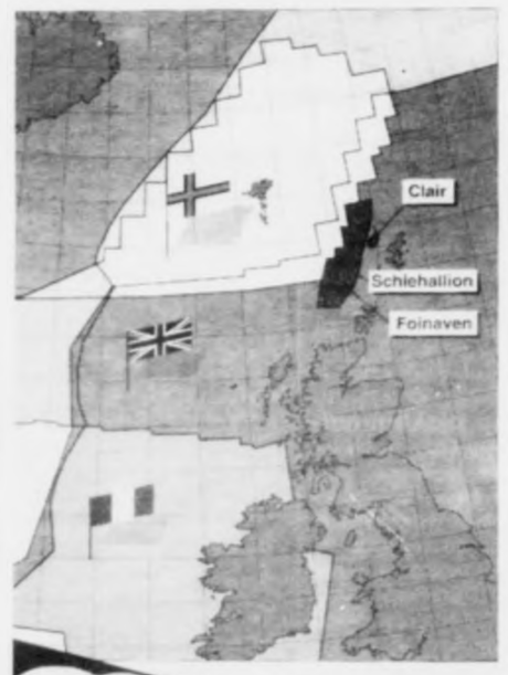
Marknaðsemjan svir seg um eitt rættiliga stórt óki í millum fleiri lond.

kláringin fór at koma fyrri ella stutt eftir. Men so skjótt skuldi tað ikki ganga. — Men verður tað aðrenn veturin kemur og lands- stjórn skal til at stýkka ut óki við Føroyar at lata olju feløgnum at bora á? — Tað er greitt, at spurn- ingurn um útbjóðing av okjum má í hvussu er hava eitt ávíst samband við, hvussu tað stendur til við marknamalimum