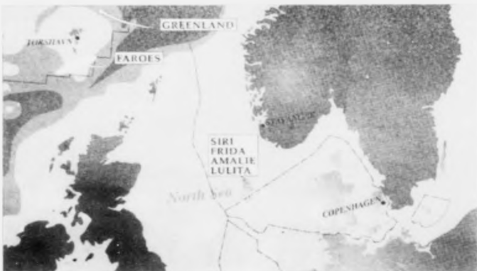
Hetta kortið hjá Statoil í Danmark visir ahugamali hjá felagnum í danska kongarikinum í Siri hava teir nú raki við olju og arbeiði verður eisini í bæði føroyskum og grønlandskum øki.