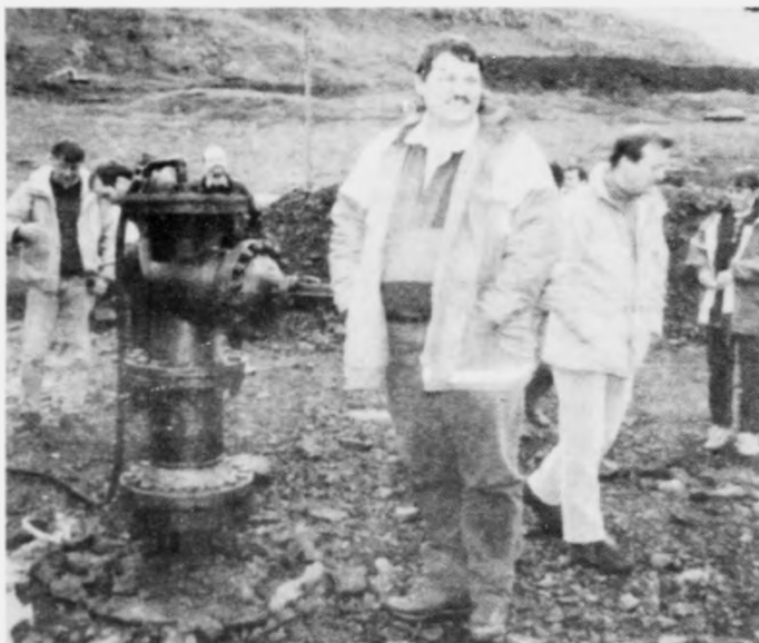
Umboð fyrri oljufeløg vitja í Lopra.

Nýggjur skógvahanðil í Saltangará letur upp í dag leygardagin 4/11 kl. 9.00 við nógvum góðum upplatingartilboðum Øpið er til kl. 17.00