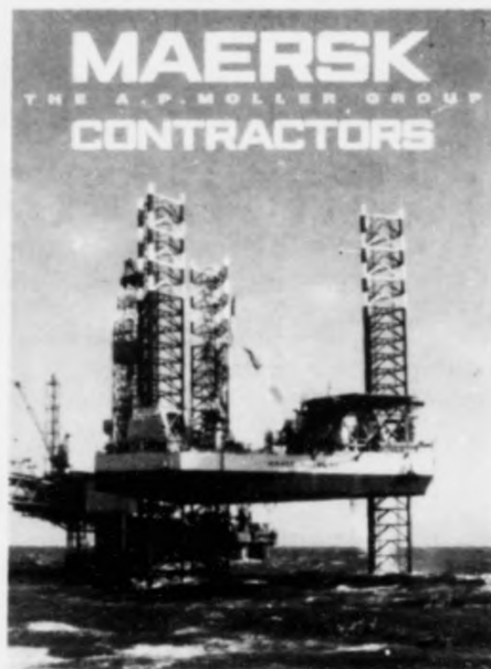
Mærsk Oilie og Gas er við á fundinum i dag. Fyrirtøkan hevur nógvs sýstur feløg. Okkurt arbeiði við at bora. Um hetta fer at standa fyr sjálvari boringin er til síga.

Stjórin í Dopas um komandi Lopraboringina: