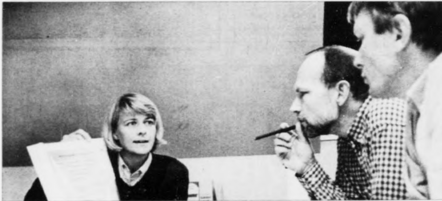
Fyrirtekurnar Dopas og DxiU leggja síðstu hon á verkætlanina í Lopra, aðrenn fundin við oljufelögin; í dag