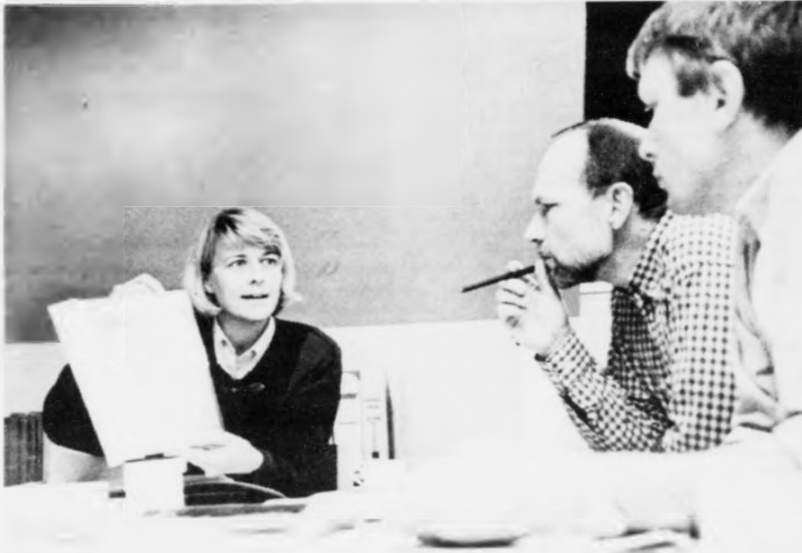
Umbøðsfrí Dopas og DGI leggja saman við samstíðingarnar semasta nunda skippergjótt til spennandi fundin í Havn í dag saman við flestu av heimisins størstu oljufrøðingum at fara undir allar boringar í Lopra.

Tá farið verður at bora í Lopra komandi ár er ikki bert talan um eina vanligu jarðfrøðiliga boring. Hóast møguleikarnir fyri at raka við olju og gass verða mettir smáir, so verður kortint arbeitt sum um talan var um eina vanligu oljuboring