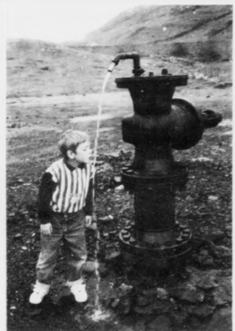
Man tað smakka av olju vatnið, sum kemur upp úr Lopransholi spvaja børn og onnur at segja, sum koma fram við borholunum í Lopra.

Órsøkin til at holið í Lopra tykist hava so storan ahuga er tann, at tu fyri rimuligan biligan penga kann bruka verandi hol at