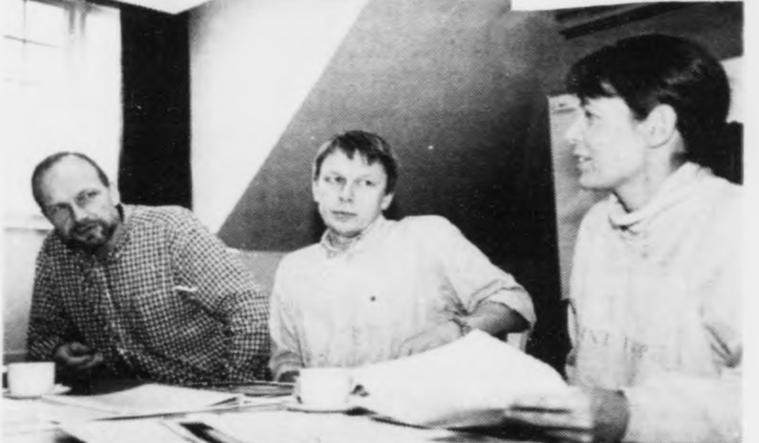
Tað eru heftiskur tímar nu bert eitt samdøgur undan fundinum við tesmongu oljufeløgnum DGI og Dopas folk á oljufyrisingini í gjar.