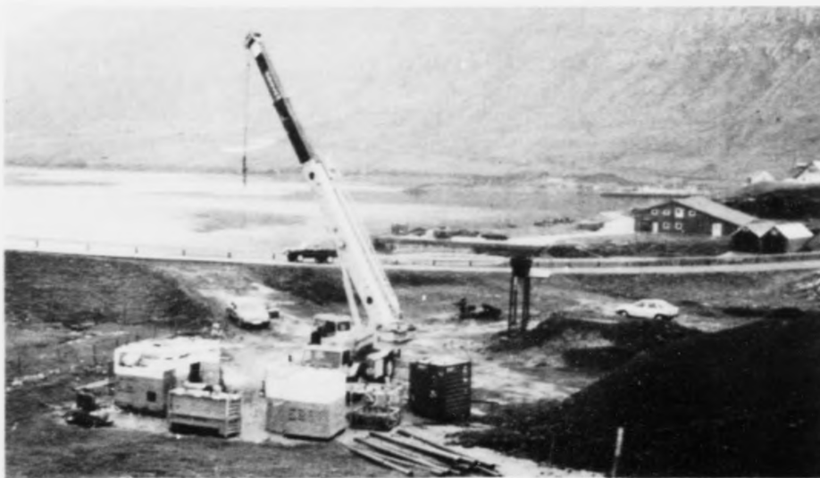
Tá Western gjørd máltingur í Lopra í fjør.

Úrslit av eini nýggjari boring í Lopra kann fáa avgerandi týðning fyr bæði Føroyar og oljufeløgini. Tað kann geva feløgum nógvs betri upplýsingar um undirgrundina og harvið økja um áhugan at vera við í fyrsta útbjóðingarmfarinum.